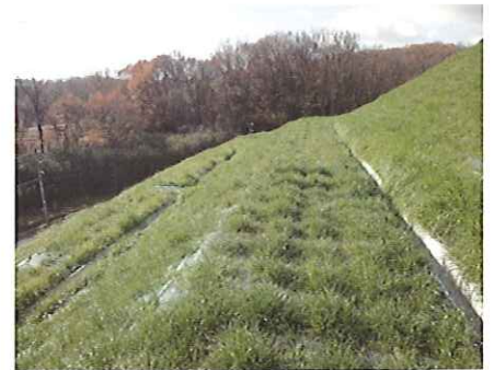
降雨等による法面の浸食防止に最適