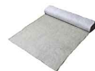
ナチュレエコジュート