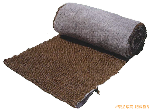
※製品写真: 肥料袋なし