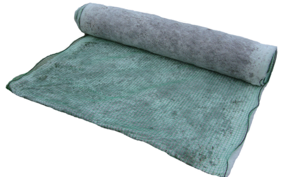
※製品写真:金網なし